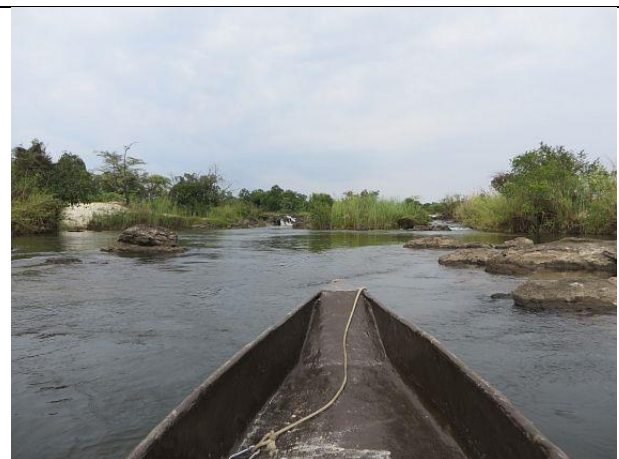
Mokoro auf dem Okavango

Weiter durch den Etosha Park ging es Richtung Westen. Da das Auto immer noch nach links zieht haben wir in Tsumeb die Spur einstellen lassen. Jetzt fährt das Auto wieder geradeaus – tolles Gefühl so nach rund 10.000km ☺, - meine „Brüder“ in Tansania hatten das nicht so ganz genau hingekriegt.