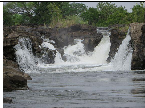
Popafalls im Caprivi/ Namibia

Weiter über Maun ging es wieder etwas nach Norden in den Caprivi nach Namibia (endlich, der letzte Grenzübergang☺). Hier in der Nähe der Popa-Falls waren wir einige Tage auf dem Camp der Nunda Lodge (wieder Luxus genießen zum Campertarif ☺, aber im Dachzelt statt in der Suite ☹) Eine Mokokrofahrt zu den Wasserfällen (OK, das Wasser fällt nur 2 Meter – trotzdem schön) haben wir hier unternommen.