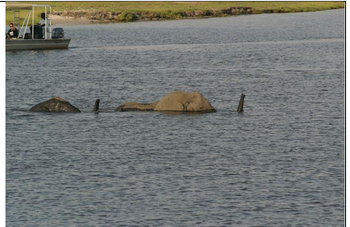
Elefants Crossing !!