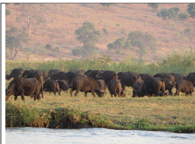
Büffelherde am Chobe