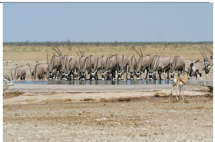
Etosha Nationalpark - 23 Oryx bei 32 Grad