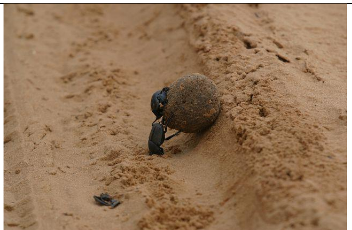
Kraftakt – wo ist die Teerstraße?