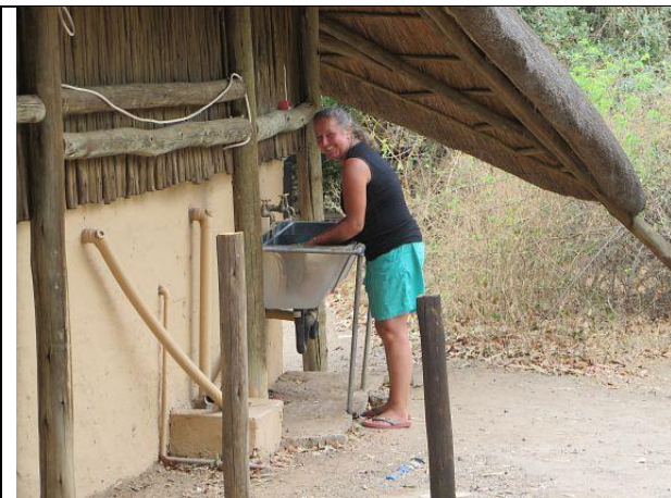
Sie kriegt nicht genug davon - Vergnügungssucht