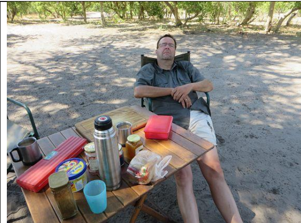
Afrikanische Spontanermattung – heimtückisch ....

..... Rückreise.. Botswana.. savuti ....Zambezi... Caprivi..... Etosha..... Palmwag..... Swakopmund....Autoverkauf... Tschüss Afrika