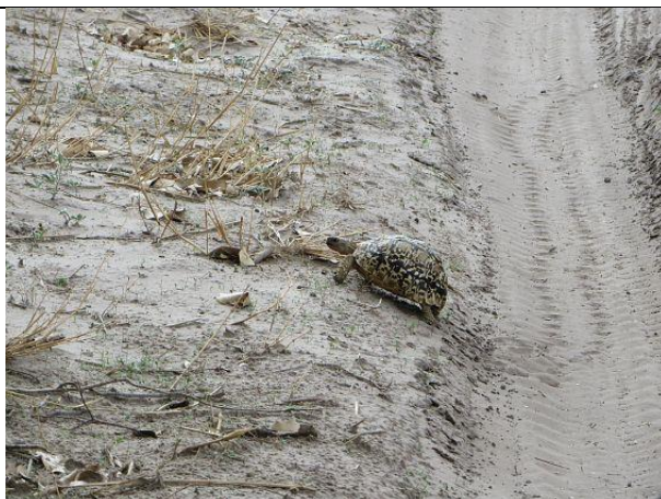
In der Fahrspur !!