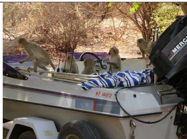
Bootsfahrt – mal anders