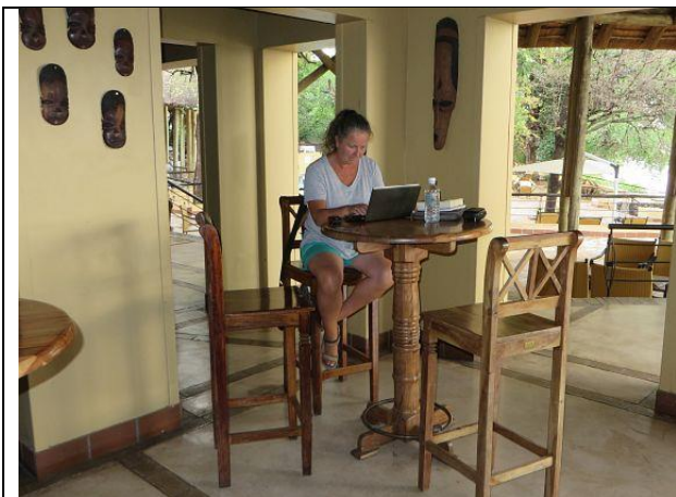
Free WIFI – cheap beers – yes!!!

So ging es Anfang November bei Kasane im 4-Ländereck Botswana, Namibia, Zambia und Zimbabwe mit der Fähre über den Zambezi nach Botswana. Übrigens heißt der Zambezi hier Chobe. Eine Woche lang waren wir auf der Zambezi Safari Lodge auf der Campsite und genossen den Luxus der Lodge. Eine Bootsfahrt auf dem Zambezi/ Chobe und eine Fahrt in den nahegelegenen Chobepark haben wir uns gegönnt.