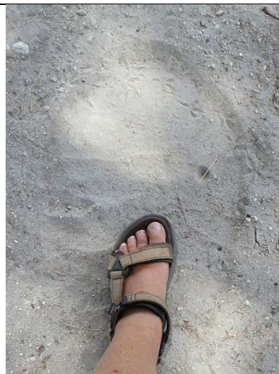
Größe 38 ???