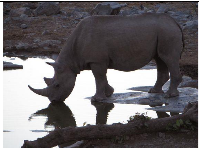
Etosha Park, Camp Halali