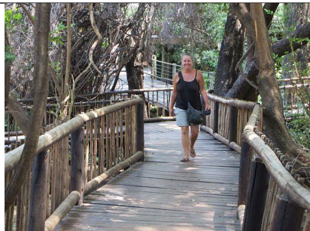
Chobe Safari Lodge