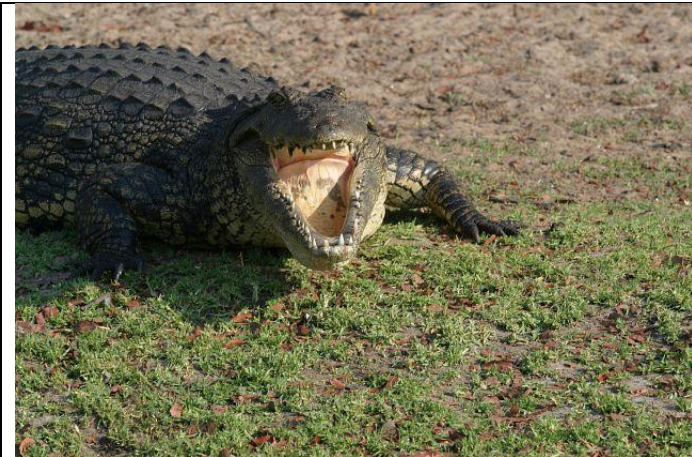
HA HA HA

..... Rückreise.. Botswana.. savuti ....Zambezi... Caprivi..... Etosha..... Palmwag..... Swakopmund....Autoverkauf... Tschüss Afrika