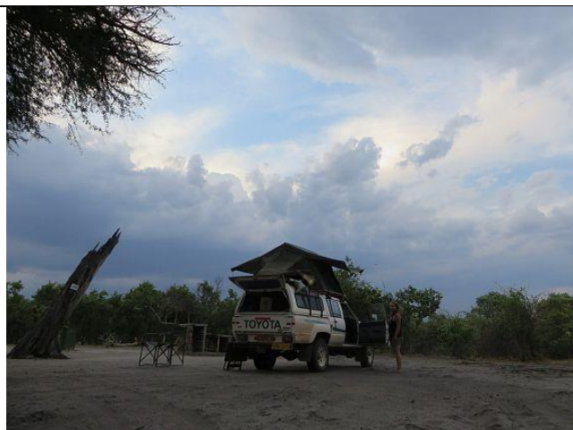
Regenzeit im Anmarsch

..... Rückreise.. Botswana.. savuti ....Zambezi... Caprivi..... Etosha..... Palmwag..... Swakopmund....Autoverkauf... Tschüss Afrika