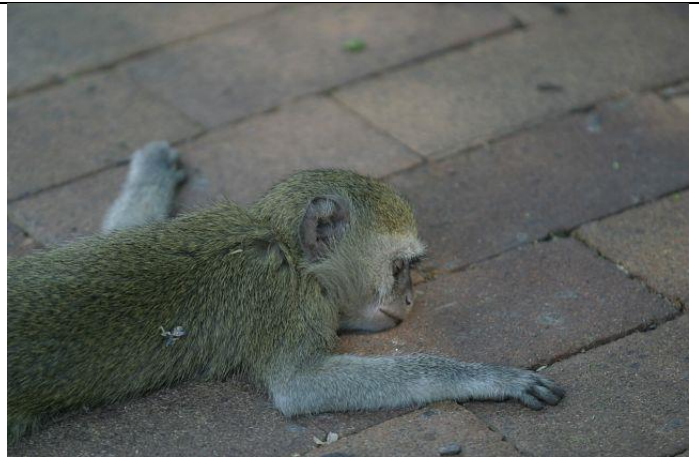
.... befällt auch kleine Affen

Weiter in Richtung Süden ging es durch den Chobe Nationalpark nach Savuti, einem schönen Camp, in dem es schon auch mal Besuch von Elefanten oder anderen Tieren gibt. Auf dem Weg dorthin haben wir Südafrikaner getroffen, denen wir unsere Sandbleche verkaufen konnten – wir bereiten uns ja schon auf den Verkauf des Autos vor und haben so auch gleich unsere Reisekasse etwas aufgefüllt – bei den hohen Parkgebühren in Botswana hilfreich.