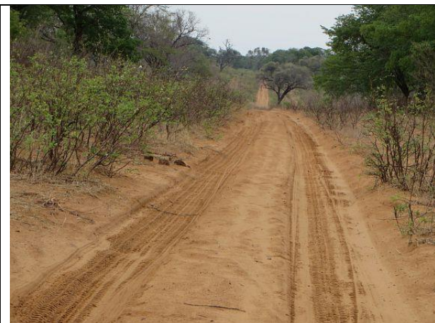
Endlich keine Teerstraße mehr – Fahrt nach Savuti

Weiter in Richtung Süden ging es durch den Chobe Nationalpark nach Savuti, einem schönen Camp, in dem es schon auch mal Besuch von Elefanten oder anderen Tieren gibt. Auf dem Weg dorthin haben wir Südafrikaner getroffen, denen wir unsere Sandbleche verkaufen konnten – wir bereiten uns ja schon auf den Verkauf des Autos vor und haben so auch gleich unsere Reisekasse etwas aufgefüllt – bei den hohen Parkgebühren in Botswana hilfreich.